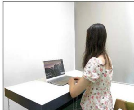
图3：侧后方第二机位效果图